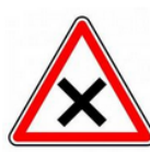
Priorité à droite applicable